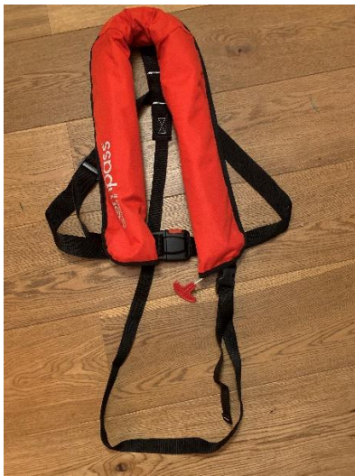
1. (open) Compass reddingsvest

Bij het onderdompelen in water worden beide reddingsvesten volautomatisch opgeblazen. Buiten het water of bij falen van de opblaasautomaat kan het reddingsvest geactiveerd worden door krachtig aan het handbedieningskoord te trekken. Het reddingsvest heeft een patroon die het reddingsvest(16liter) geheel opblaast. Zorg dat de handbediening(rode knopje) zich altijd buiten het reddingsvest bevindt. Mochten de opblaasautomaat en de manuele bediening beiden niet werken is er altijd de mogelijkheid om deze zelf op te blazen via een blaaspijp die onder de bovenmantel zit(zie foto 6). Wanneer het nodig is om het vest te legen gaat dit ook via het blaaspijpje. In het pijpje zit onder het stofkapje een dopje wat je in kunt drukken waardoor lucht kan ontsnappen. Let op je drijfvermogen neemt dan sterk af!