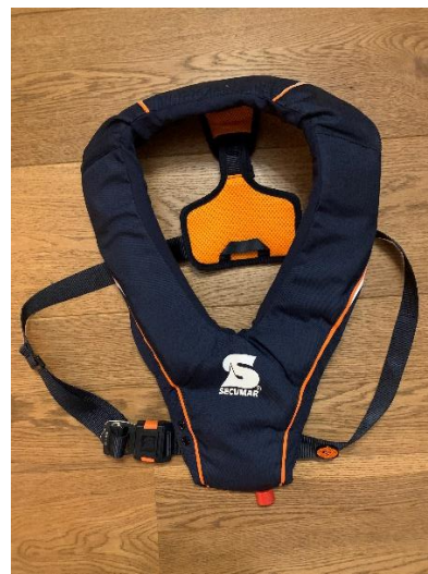
2. (gesloten) Secumar reddingsvest