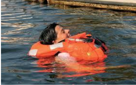
5. Reddingsvest te water

Open het reddingsvest met de hand en blaas het drijflichaam via het mondventiel met de mond op. Verwijder hiervoor de stofkap van het ventiel. Als het vest na activering via het mondventiel extra wordt opgeblazen moet voorkomen worden dat er CO 2 -gas uit het drijflichaam wordt ingeademd (niet giftig, maar hoestprikkel of sufheid mogelijk).